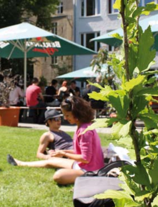
Hofgarten des GLS Campus mit Schule, Hotel und Restaurant.