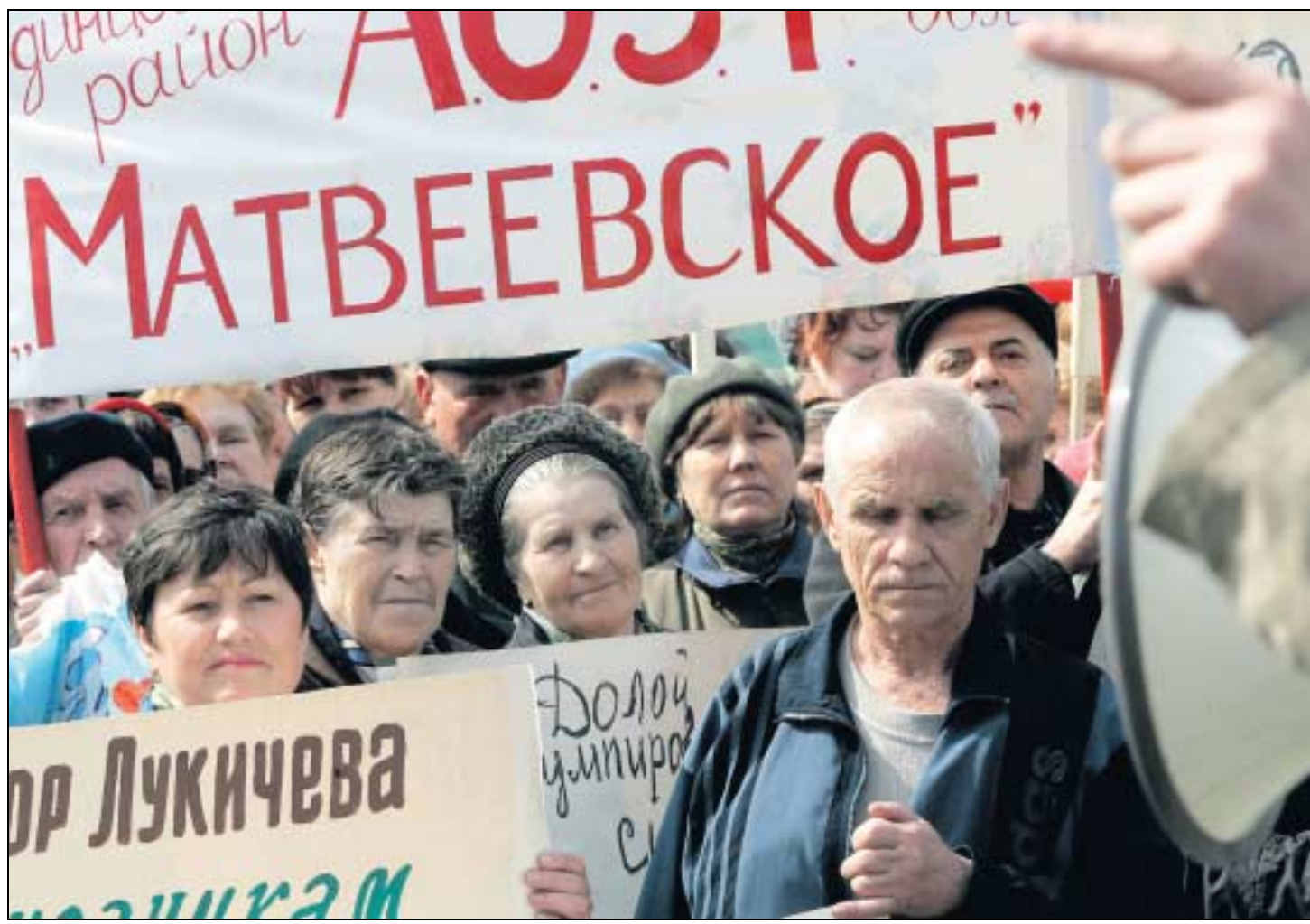
Bauern und Landarbeiter protestieren in Moskau gegen Korruption und das Konfiszieren von Land.

Risiken werden dabei in Kauf genommen. Korruption mag in Russland tief verankert und weit verbreitet sein – legal ist sie nicht. Steuerhinterziehung und Bestechung können hohe Gefängnisstrafen zur Folge haben. Anonyme Hotlines des Finanzamtes erleichtern die Denunziation durch unzufriedene Mitarbeiter oder Konkurrenten. Mitwisser fragwürdiger Buchführungsmethoden können in der Lage sein, die Geschäftsführung zu erpressen. Russische Unternehmer mögen darauf unzimpflich reagieren, unter Druck geratende westliche Geschäftsleute laufen dagegen Gefahr, ihre Handlungsfähigkeit